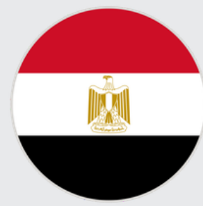
جمهورية مصر العربية