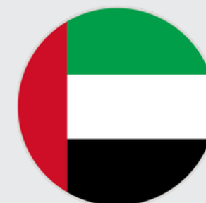
الإمارات العربية المتحدة