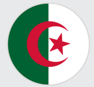
الجمهورية الجزائرية الديموقراطية الشعبية