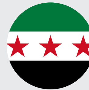
الجمهورية العربية السورية