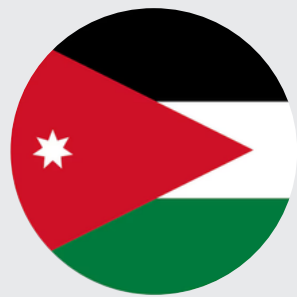
المملكة الاردنية الهاشمية